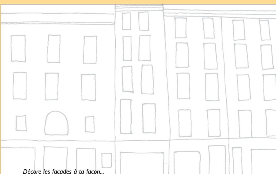
Décore les façades à ta façon...