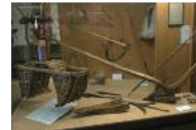
Casa Pairal : vitrina de l'agricultura.

L'oliu La plana del Rosselló que envolta Perpinyà era coberta de cultures panificables i d'olis preciosos pel seu oli : sagrat a les esglésies, llum a les llars o senzilla alimentació, l'oli d'oliva és un element molt important de l'agricultura rossellonesa.