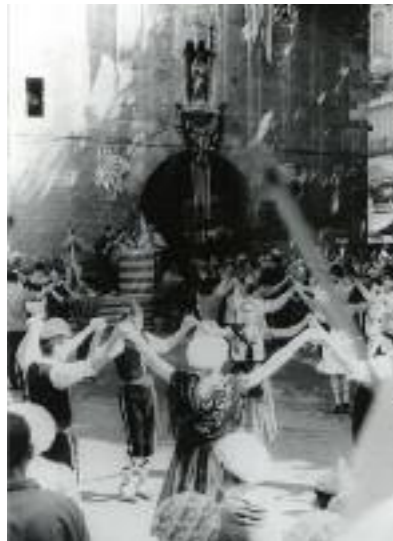
Inauguració del Castellet.

En començar els anys 1950, el projecte de fundació d'un museu de les arts i tradicions populars torna a plantejar-se, amb els encoratjaments de la municipalitat i el descobriment per Josep Deloncle d'un vell goig (cant popular religiós sobre fusta gravada).