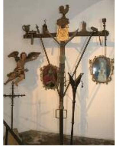
Creus dels impropers, col·lecció Casa Pairal.

Aquestes festes són tan popular, que desplacen cada any molts participants, des dels més fidels catalans fins als turistes cada cop més nombrosos.