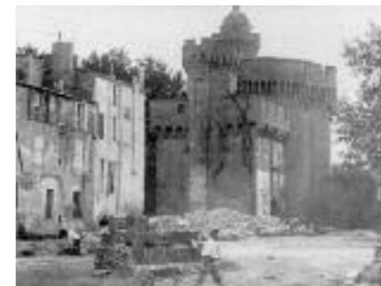
Demolició de les muralles Nord (1904).

Més tard, durant la Revolució francesa, la major part dels presoners són sacerdots, emigrats i nobles.