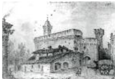
Gravat Bagnères de Luchon al segle XIX, col·lecció privada de Pierre Gorsse, 1956, col·lecció museu Jacint Rigau.

Durant aquestes obres hom forada unes troneres pels arcabussos, molt més nombroses del costat de la vila i s'obren finestres fortament enreixades sobre la façana exterior. Un terrat emmerletat i un bonic fanalet es basteixen al cim del monument per a sostenir els canons i vigilar la plana del Rosselló. El Castellet s'enriqueix igualment d'una nova porta a l'est, i d'un baluard (avui desaparegut) al nord.