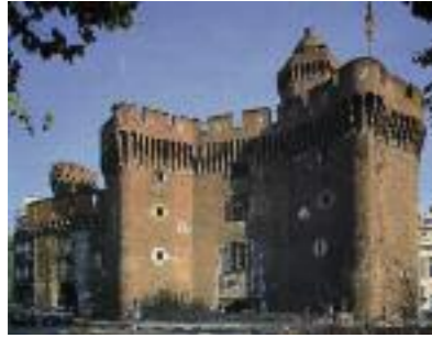
El Castellet, façana Nord.

El Castellet era la porta principal de la vila anant a França.