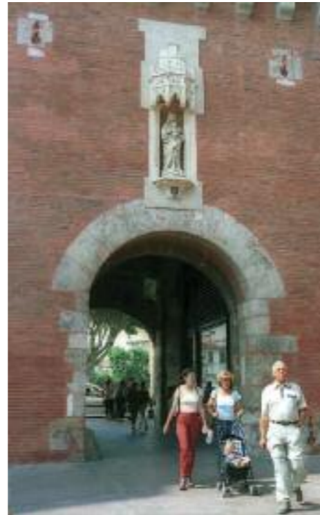
Porta de Nostra Dama.