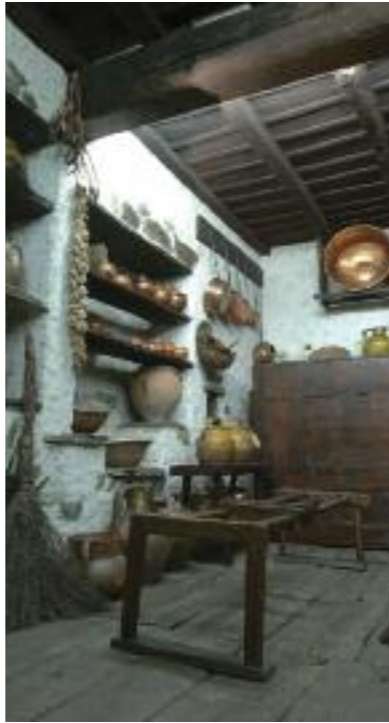
Casa Pairal, reconstitució de la cuina del mas del Gleix, eines Alts Aspres.

La cuina és el lloc de vida de la casa. Allí la família entera és retrobada i aquell espai és el de tots els intercanvis entre generacions: l'àpat a l'entorn de la pastera, la vetllada a la vora del foc... El teulat esdevé aleshores el símbol de la família i les seves teules decorades, art esquemàtic estereotipat molt proper dels pastors, protegeixen la casa dels mals auguris.