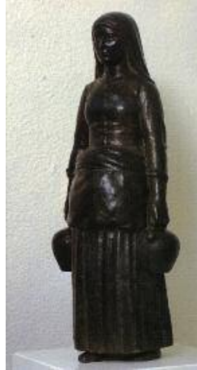
Gustau Violet, Catalana amb càntirs, de terrissa, 1911, col·lecció museu Jacint Rigau.

El 1983, el museu pot, per fi, ocupar totes les sales. Símbol de la història rossellonesa, el Castellet ha esdevingut avui dia el monument de la identitat catalana.