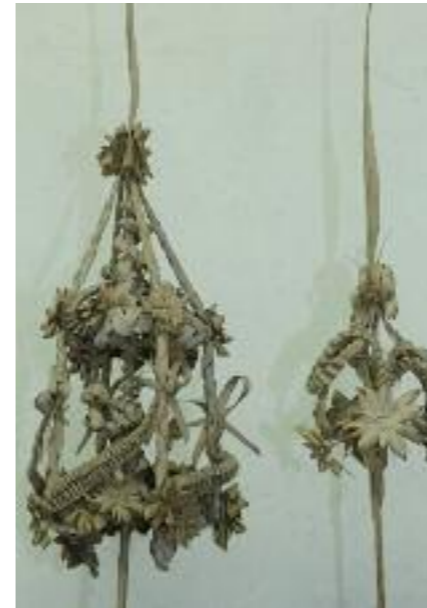
Rams, col·lecció Casa Pairal.

La comunió i el casament són cerimònies de pas, una mena de ritus iniciàtics d'un estat a un altre.