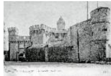
El Castellet abans de la demolició del baluard de Carles V.

El Castellet és un dels rars vestigis del recinte fortificat que envoltava Perpinyà.