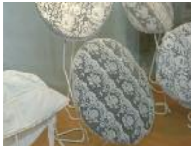
Còfies catalanes, col·lecció Casa Pairal.

Fins al segle XVI e , unes benes de vel mantenen els cabells de les dones. Després a l'inici del segle XIX e , la indústria de fer puntes s'expandeix molt a Perpinyà; la còfia catalana, avui part integrant del vestit català femení tradicional, doncs és molt recent.