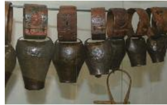
Borrombes de moltons, collarets de fusta esculpits, col·lecció Casa Pairal.

Al Rosselló tot s'imbrica sense malgrat tot confondre's : el temps de l'esforç, el temps religiós, el temps agrícola, la festa. Cada acte major de la vida familiar i social esdevé el senyal identitari reconegut per la comunitat.