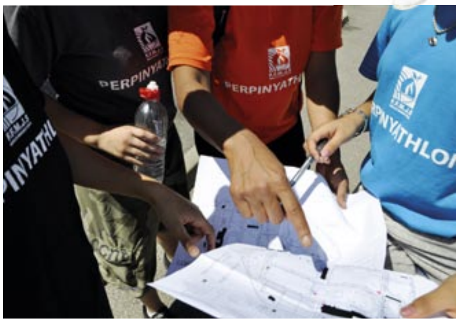
Le Perpignath'on, un mini raid urbain annuel fin septembre.

B.P : Oui et nous avons aussi un grand nombre de projets en ce domaine. Tout d'abord, nous allons lancer une nouvelle formule du Conseil Municipal des Jeunes qui sera installé en janvier. Idée maîtresse : avoir une plus grande proximité avec nos territoires et les citoyens. Je citerai aussi le Fonds Initiative Jeunes qui leur permet de formuler des propositions concrètes