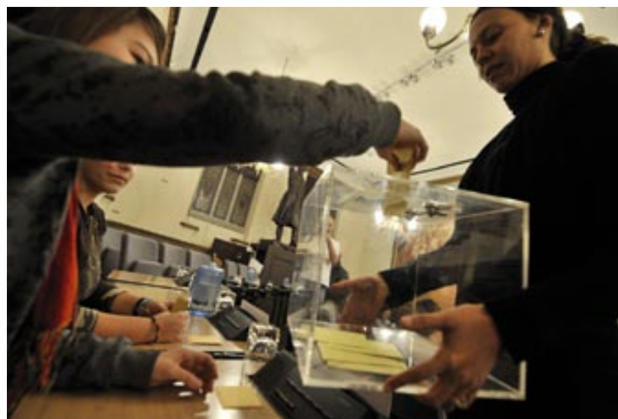
Une nouvelle formule du Conseil Municipal des Jeunes sera installée fin janvier prochain.