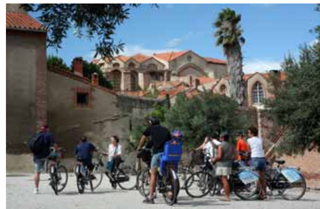
Les balades à vélo, promenades instructives et sportives.

Une création contemporaine mettant à profit le passage existant de l'eau pour reconstituer un environnement d'ambiance méditerranéenne. De la colline sèche au plan d'eau, ces visites permettent de découvrir comment les aménagements de l'homme encouragent l'implantation d'une nature sauvage tout autant qu'ils améliorent la qualité de vie des quartiers environnants.