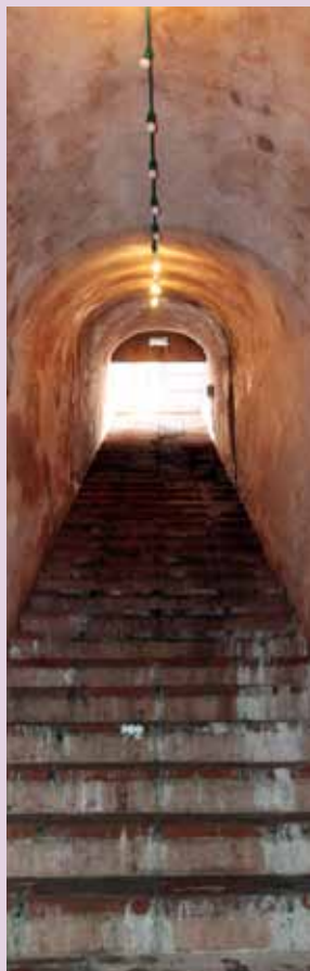
L'escalier descendant au Mikvé, bain rituel juif.

Sous le patio du cloître du Couvent des Minimes, un escalier à angle droit descend à 15 mètres sous terre. Il mène à un bassin de pierre surmonté d'un mur du XII ème ou XIII ème , qui était alimenté par la source proche et l'eau de pluie. Aucun autre élément architectural ne correspond en surface à cette datation.