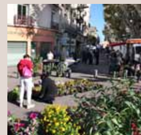
Des airs de village dans les marchés de quartier !

Rue Foch et place Vaillant Couturier, les mercredis et samedis de 7h30 à 13h30