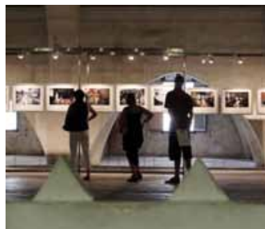
Visa pour l'Image : engagement des professionnels, fidélité du public.