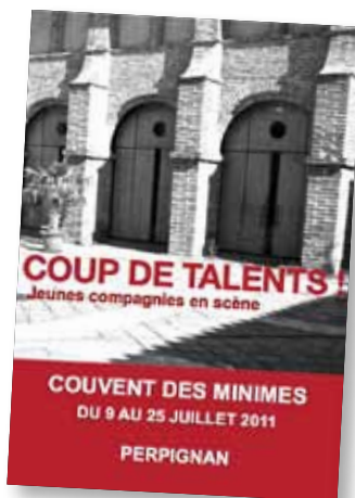
Coup de talents ! Compagnies locales et régionales à découvrir dans l'écrin du Couvent des minimes.

Programme à télécharger sur : www.lesestivalesdelarchipel.org