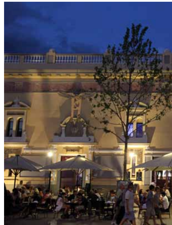
La Place de la Victoire, un décor de théâtre à ciel ouvert.

Jeudi 14 juillet, comme chaque année, c'est le cœur de la ville qui battra au rythme de cette grande fête et verra la musique déclinée sous différentes notes : dès 20h45 les « Salanc'aires » donneront le « la », nous invitent à entrer dans la danse en longeant le quai Vauban pour rejoindre le groupe « Cotton belly's » au pied du Castillet, tandis que la cobla « Mil.lenaria et les Primavera » nous prendrons par la