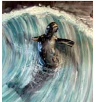
La Sirène, 2011. Technique mixte et huile sur toile (200 x 200 cm) de Stéphane Pencreac'h, Galerie A cent mètres du centre du monde.

Av. de Grande Bretagne Tél. : 04 68 34 14 35 www.acentmetresducentredumonde.com Ouvert tous les jours (dimanches et jours fériés inclus) de 15h à 19h