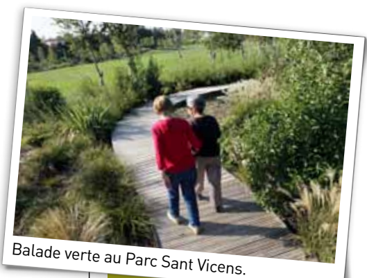
Balade verte au Parc Sant Vicens.

se mêlent patrimoine culturel et naturel. Enfin, terminez par un peu d'exercice en participant aux « Visites à vélos » tous les lundis à 10h30 ou encore à un « Tour des saveurs à vélo » au cœur des jardins Saint-Jacques à la rencontre des producteurs avec dégustation de fruits et vins du Roussillon. Belle balade en compagnie de Dame Nature ! ■ Renseignements et inscriptions : Office de Tourisme Tél. : 04 68 66 30 30 www.perpignantourisme.com