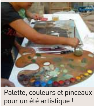
Palette, couleurs et pinceaux pour un été artistique !

Musée des beaux-arts Hyacinthe Rigaud, 16 rue de l'Ange. Renseignements et inscriptions : 04 68 35 43 40