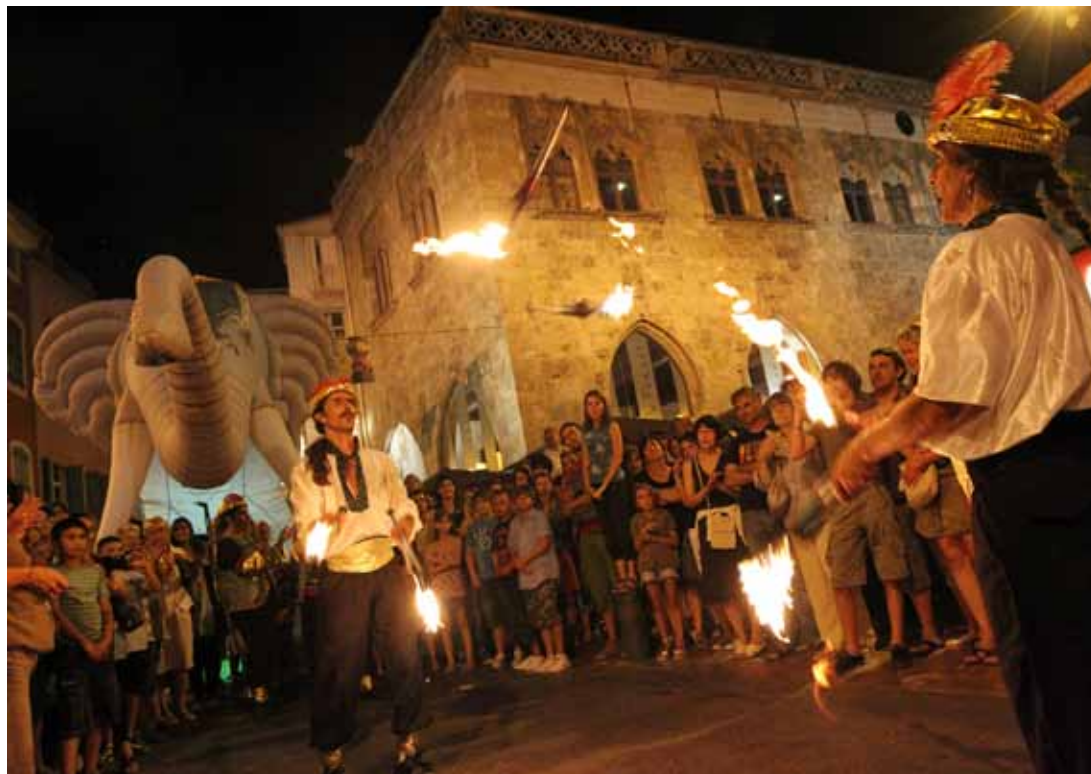
Les Juedis de Perpignan, les juedis où la fête s'empare de la ville.