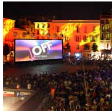
Une ambiance de fête lors de la soirée de projection du festival OFF.

L'association OFF de Perpignan avec la Chambre de Commerce et d'Industrie (CCI) et la Ville de Perpignan, vous donnent rendez-vous pour la 16 ème édition du festival Off du photoreportage amateur, du 27 août au 10 septembre. Les commerçants vous accueilleront pour vous faire découvrir plus de 60 expositions photos de qualité. Cette année le festival Off reçoit un invité d'honneur : Cyril Tricot, cinéaste catalan, spécialisé dans les reportages marins et sous-marins. Les rendez-vous incontournables :