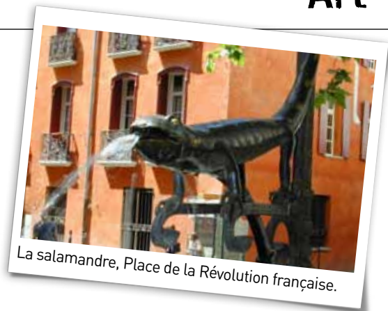
La salamandre, Place de la Révolution française.