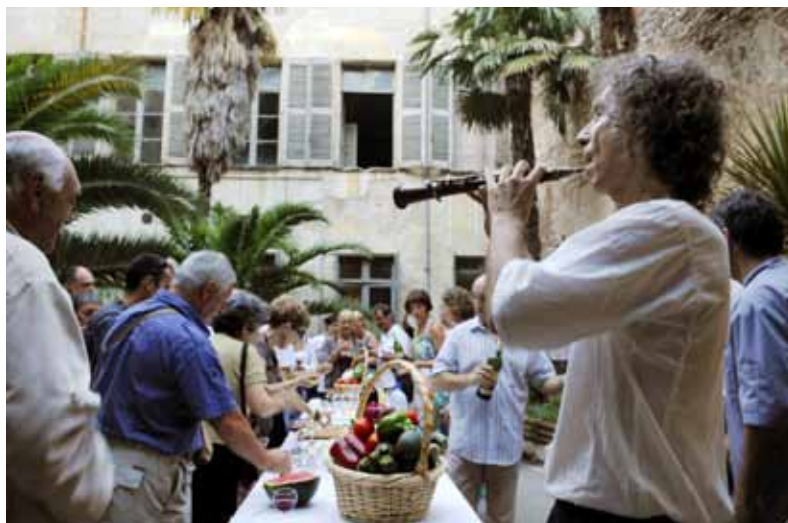
Pause gourmande au cœur des patios.

Ancrée dans la plaine, au pied du Canigou, Perpignan démontre de manière éclatante que la vie ici ne ressemble à aucune autre. Ouverte à tous les courants, à toutes les cultures, découvrez et goutez la « Villa Perpiniarum », plus ancienne mention de la Ville de Perpignan qui remonte à l'an 927 !