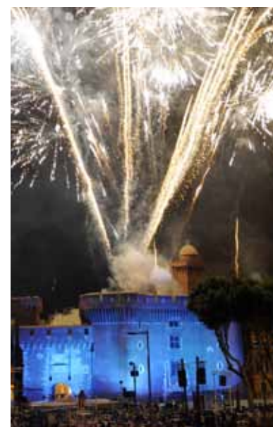
Le traditionnel feu d'artifice du 14 juillet, un spectacle époustouflant !

main près de la scène au pied du Castillet. Moment magique à 23h, quand tiré du Castillet, le spectacle pyrotechnique, son et lumière, embrasera de mille étoiles le ciel de Perpignan. Dès 23h30 reprise des animations musicales au Castillet, place Arago, quai Vauban, place de la Loge. Bonne fête nationale et surtout bonne soirée !!!