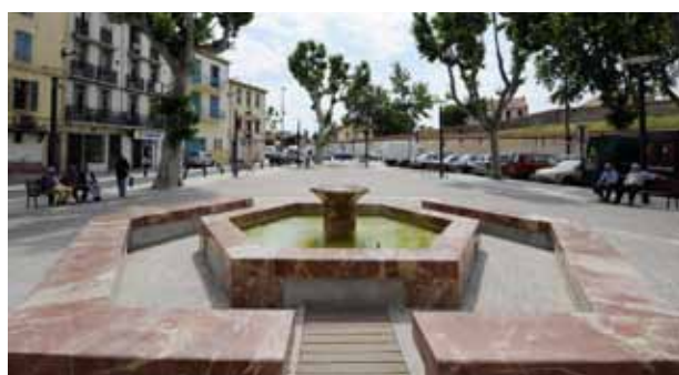
La fontaine place des esplanades.

Commençons par la fontaine de la Place des Esplanades : sous l'ombre des grands platanes, cette fontaine aux bassins asymétriques apporte sa fraîcheur à une ravissante petite place ouverte sur des maisons colorées, en lisière du quartier Saint-Jacques. Un peu plus loin, rue Emile Zola, la fontaine de l'abreuvoir, se niche entre les maisons du quartier gitan, haut en couleurs et en sons et fait la joie des enfants. En descendant le long de la rue Foy, le bassin de la fontaine Na Pincarda avec son bas-relief vous accueille sur la charmante place du figuier. Quelques mètres encore, et voici la plus jolie de fontaine de Perpignan, sur la place de la révolution française, avec ses airs de piazza vénitienne