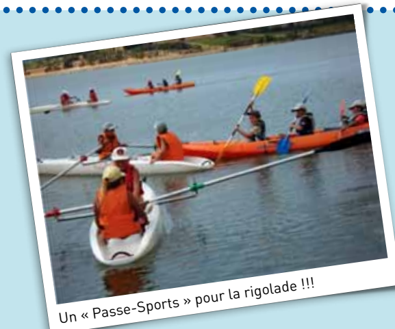
Un « Passe-Sports » pour la rigolade !!!

communes de l'Agglomération ont été conviés à l'opération qui se déroule en semaine, du 6 juillet au 5 août, de 9h à 12h au Parc des sports de Perpignan et sur la base nautique du Lac de Villeneuve-de-la-Raho. Divers ateliers sportifs sont proposés : hockey, baseball, karaté, tennis, kayak, aviron... Diplôme en poche, les participants pourront, s'ils le désirent, contacter les associations sportives qu'ils souhaitent intégrer à la rentrée. ■ Renseignements : Direction des sports - 04 68 62 39 00