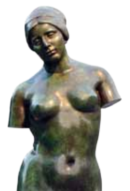
L'été sans bras à admirer sur les allées Maillol.

► L'Été sans bras : Maillol sculpte 4 statues représentant Les 4 Saisons : • La Pomone (1910), • L'Été (1911), • Flore (1911), • Le Printemps (1911). L'Été commence par un torse puis devient, L'Été sans bras, œuvre presque définitive de L'Été.