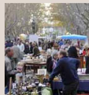
Venez chiner à la brocante le long des allées Maillol.

Allées Maillol, 1 er samedi du mois de 8h à 18h30