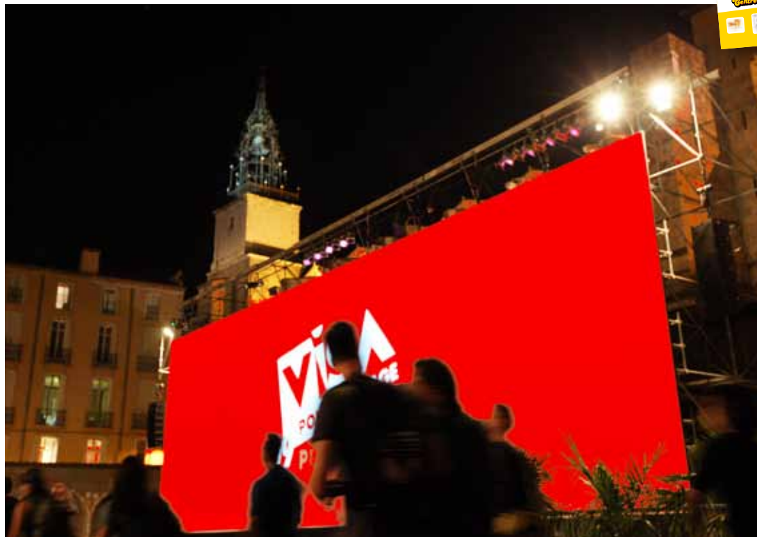
23 ème édition cette année pour le festival international de photojournalisme.