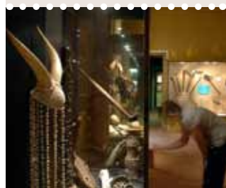
Le Muséum d'Histoire Naturelle dévoile ses secrets...