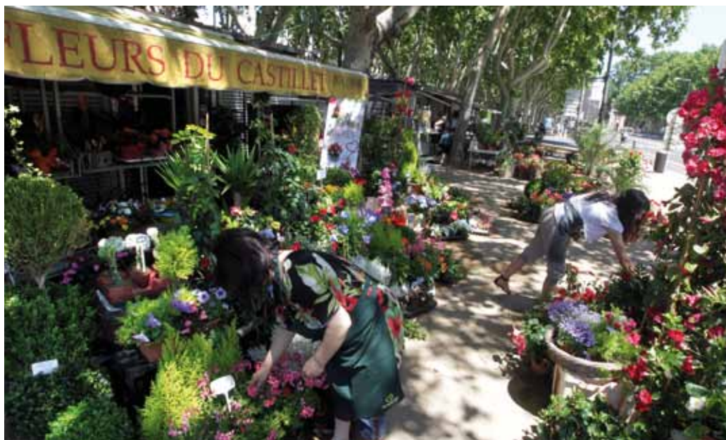
Le marché aux Fleurs : senteurs et couleurs au programme.

Pendant que la brise fraîche du matin est encore installée, selon le choix du menu, la journée commence dans le quartier Saint-Martin entre la rue Foch et la place Vaillant Couturier. En se promenant à travers ce marché les couleurs vives réveillent nos sens, les parfums attisent nos papilles : mesclun de salade, tomates mûres à point, asperges sauvages... notre panier se remplit peu à peu de produits de saison. Un peu plus bas, au Sud de la ville, au Moulin à Vent, sur la place de la Sardane et de Montbolo, nous trouvons viandes et poissons et peut-être un chapeau de paille pour se proté-