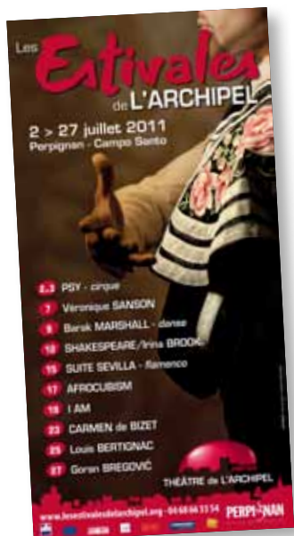
Les Estivales de l'Archipel, le rendez-vous incontournable du mois de juillet.

Un rendez-vous à ne pas manquer au mois de juillet : Les Estivales de l'Archipel. Laissez-vous porter par la douceur des « nuits d'été, nuits de rêve », thème de l'édition 2011. Une programmation variée et pluridisciplinaire vous est proposée au cours de 10 soirées avec pour décor le superbe Campo Santo. Théâtre, danse, concerts... des spectacles de qualité, grand public avec des artistes aussi talentueux que Véronique Sanson, I Am, Louis Bertignac ; des bijoux à découvrir comme la troupe « Afro-cubism », l'époustouflant spectacle de cirque « Psy », le renversant ballet « Monger », la pièce de théâtre « en attendant le songe », l'envoûtant spectacle de Flamenco « Suite sevilla », l'opéra « Carmen », ou encore le célèbre compositeur de musiques de films Goran Bregovic, maître du mélange des cultures, accompagné d'une fanfare gitane, de