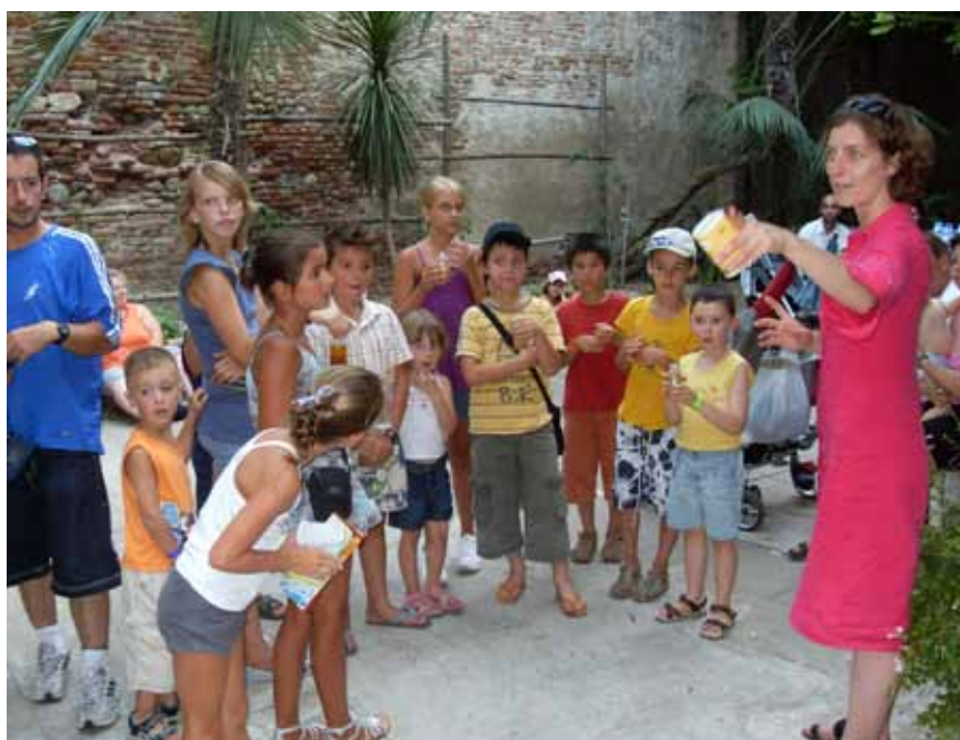
Des enfants fins prêts pour une Chasse au Trésor passionnante au cœur de la ville !

Répartis en équipes, une feuille de route à la main, vous devrez sans cesse écarquiller les yeux pour