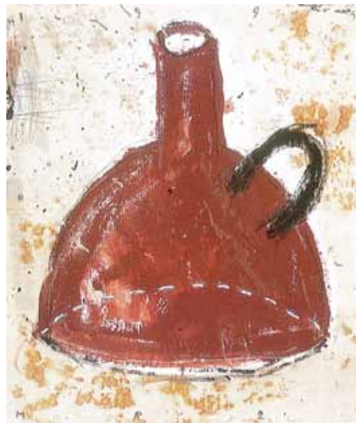
Entonnoir, Marc-André 2 Figuères.

Exposition présentée jusqu'au 30 septembre : Rez-de chaussée du Museum d'Histoire Naturelle, de la Casa