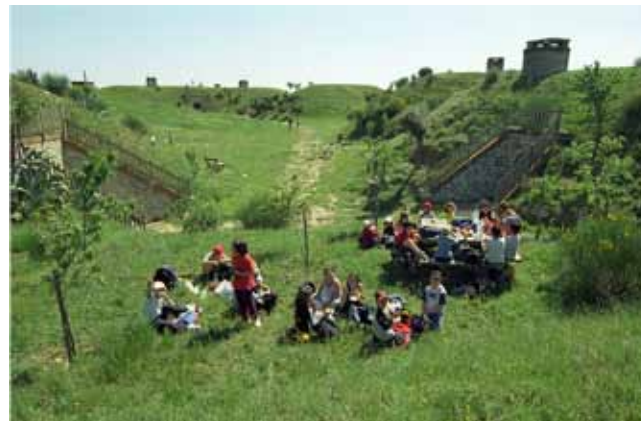
Pause nature au Serrat d'en Vaquer.