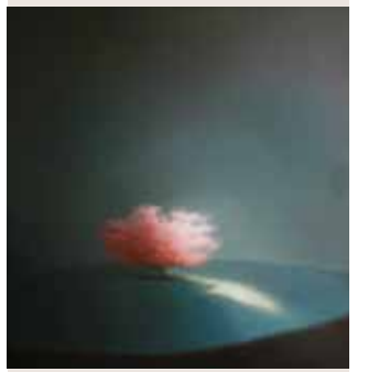
The crying tree - huile sur toile 130x130cm, Galerie Artrial.

30 pl. Hyacinthe Rigaud Tél. : 04 68 62 97 05 www.artrial.fr Du mardi au samedi, 10h-13h / 14h-19h