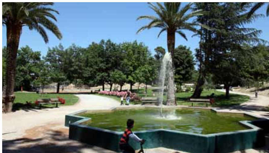
Le Parc de la Pépinière, un coin de nature en ville.

Les parcs et jardins sont des havres de paix intergénérationnels au cœur du tissu urbain. En centre-ville, le square Bir Hakeim fait office de poumon vert. Implanté sur les anciens fossés des remparts, le square est une institution verte depuis 2 siècles. Secteur Ouest, le Parc de la Pépinière existe depuis 1818 et offre un coin de verdure aux habitants et une aire de jeux aux enfants. Plus loin, les berges de la Basse proposent un parcours agréable et reposant. Au Nord, c'est le Parc Maillol, parc urbain de 8 ha, qui offre une respiration aux quartiers du Haut et Bas-Vernet. Une promenade est également possible le long des jardins de la Digue d'Orry construite au XVIII ème siècle, en amont du Pont Joffre. Un jardin exotique y a été aménagé, véritable invitation à un tour du monde. On trouve également de nombreux jardins qui