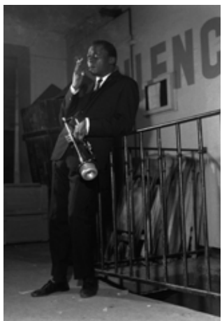
Miles Davis, Olympia, 15 novembre 1956.

Exposition présentée jusqu'au dimanche 7 août - Entrée libre Couvent des Minimes 24, rue Rabelais, Espace Boulat 12h à 19h (sauf le lundi)