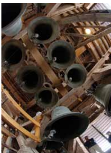
Le carillon Amédée Bollée sonnera des débuts de soirées prometteuses sur le parvis de la cathédrale.

carillon, la campanologie, l'arrangement et la composition. Perpignan et son ensemble campanaire de 46 cloches accueillent 6 écoles. Dans le cadre exceptionnel du parvis de l'église Saint-Jean-le-Vieux, un professeur accompagné d'un de ses élèves fera résonner le carillon Amédée Bollée. A signaler, l'ouverture prochaine d'une classe de carillon au Conservatoire à rayonnement régional de Musique, de danse et d'art dramatique Perpignan Méditerranée.