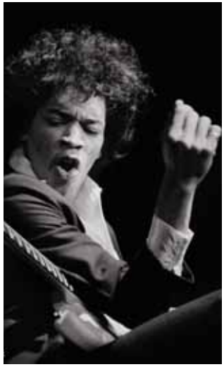
Jimi Hendrix, Olympia, 18 oct. 1966.