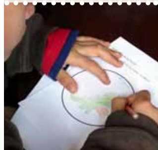
Quand didactique et ludique se mélangent...