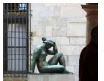
La Méditerranée de Maillol.

► La Méditerranée : elle fait sensation au Salon d'Automne à Paris en 1905, et en 1909 Aristide Maillol en fait don à la Ville. Elle se trouve dans le patio de l'Hôtel de Ville.