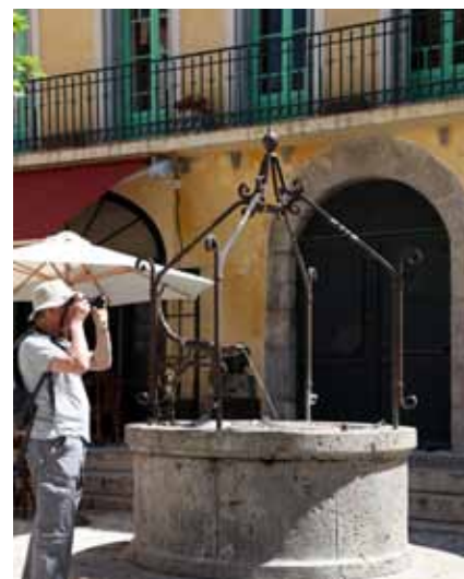
Des airs de « Piazza » italienne Place de la Révolution française.