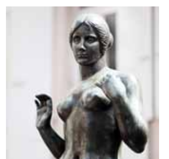
La Vénus au collier de Maillol.

► La Vénus au collier : Offerte par le fils d'Aristide Maillol, Lucien Maillol, en 1949, elle trône face à la Loge de mer, emplacement choisi par Lucien Maillol lui-même.