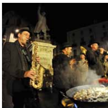
Convivialité et bonne humeur au programme des Jeudis de Perpignan.

Des animations dans toutes les rues vous guideront tout au long des soirées d'été. De superbes spectacles visuels s'installeront place de la Victoire, alors qu'une ludothèque enchantera les enfants place Gabriel Péri. Une envie de vous dégourdir les jambes ? Faites un tour au « Bal à Rigaud », guinguette installée place Rigaud avec animations musicales et danseurs venus de tous horizons : salsa, tango, musique traditionnelle, reggae... Pour les promeneurs du soir plus portés à la rêverie, attardez-vous sur les gradins au bord de la Fontaine Maillol, et admirez un spectacle coloré et musical.