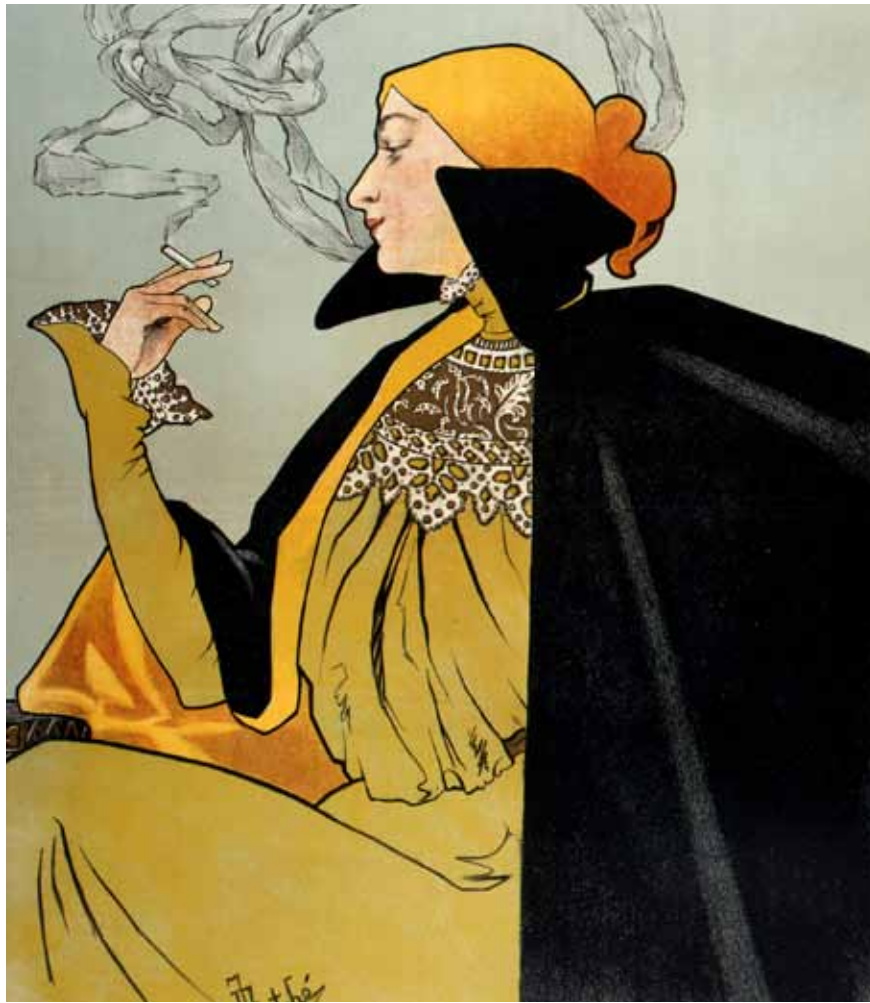
Jane Atché, affiche « Job » avant la lettre, 1896 (collection particulière).

F in XIX ème , la riche bourgeoisie industrielle s'embrace pour l'Art Nouveau. Cette évolution touche la décoration intérieure, extérieure, le mobilier et les objets du quotidien. Les supports commerciaux gagnent leurs lettres de noblesse : les affiches deviennent des œuvres d'art accessibles et visibles par des millions de personnes. La capitale