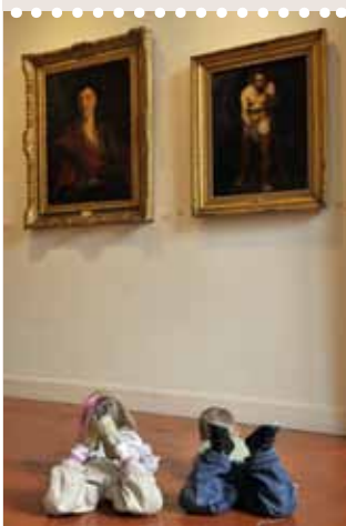
Une rencontre particulièrement intense...

Découvrir les musées à son rythme, tout en s'amusant, en pratiquant des ateliers de découverte ou par des jeux à suivre en famille :