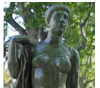
La baigneuse drapée de Maillol.

► La baigneuse drapée : installée en février 2008 sur les allées Maillol.