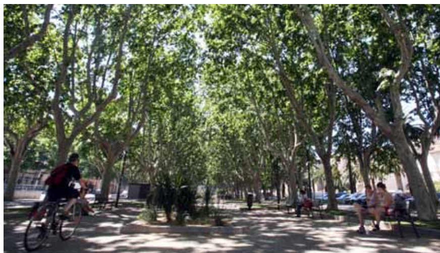
La promenade des Platanes, 2 siècles au cœur de Perpignan.

Source d'inspiration artistique, la promenade accueille depuis fort longtemps les artistes et leurs œuvres pour les offrir au regard du promeneur. Ainsi, 3 monuments de Belloc, Violet et Gili célèbrent les guerres qui ont marqué l'histoire collective, une statuaire rend hommage aux combattants morts pour la France, 2 stèles plus modestes