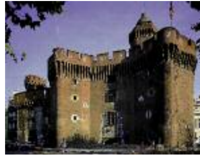
Face Nord. Photo : SAEP/A. Thiébau, in Casa Pairal, musée catalan des arts et traditions populaires.

Le Castillet était la porte principale de la ville sur la route de France. En 1368, Pierre IV d'Aragon souhaite renforcer les défenses Nord de l'enceinte majorquine. Pour financer ce chantier, les consuls de Perpignan imposent un impôt extraordinaire sur toutes les marchandises arrivant aux portes de la ville.