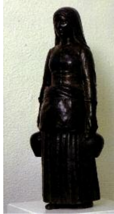
Gustave Violet, Catalane aux cruches, terre cuite, vers 1911 , coll. musée Hyacinthe Rigaud.

En 1983, le musée peut enfin occuper la totalité des salles. Symbole de l'histoire roussillonnaise, Le Castillet est aujourd'hui devenu le monument de l'identité catalane.