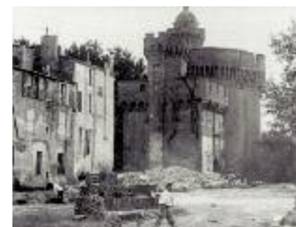
Arasement des remparts Nord en 1904, coll. Club cartophile catalan.

Plus tard, pendant la Révolution française, la majeure partie des prisonniers se compose de prêtres, d'émigrés et de nobles.