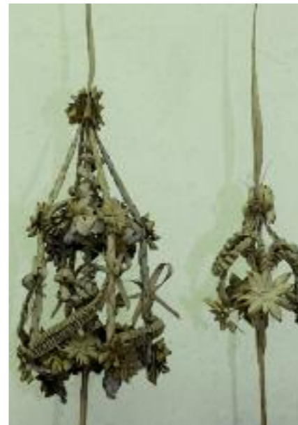
Rameaux, coll. Casa Pairal. Photo : Ville de Perpignan.

À l'inverse, l'enterrement permet de faire un adieu au mort et donne alors la possibilité d'entamer le deuil. La communion et le mariage sont des cérémonies de passage, sortes de rites initiatiques d'un état à un autre.