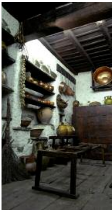
Casa Pairal, reconstitution de la cuisine du mas del Gleix, dans les Hautes Aspres.

La cuisine est le lieu de vie de la maison. Ici la famille entière se retrouve et cet espace est celui de tous les échanges entre générations : le repas autour du pétrin, la veillée au coin du feu... Le toit est alors l'incontournable symbole de la famille et ses tuiles décorées, art schématique stéréotypé très proche de celui des bergers, protègent la maison des mauvais augures.