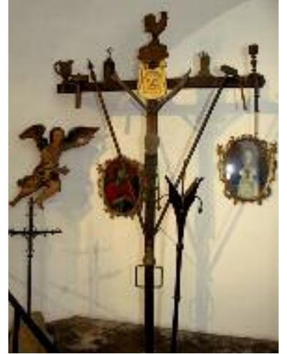
La Croix des outrages, coll. Casa Pairal.

Ces fêtes sont si populaires qu'elles déplacent, chaque année, une foule de participants, des plus fidèles catalans aux touristes toujours plus nombreux.