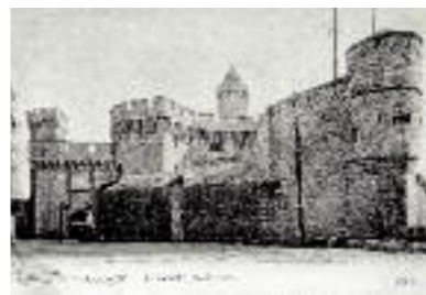
Le Castillet avant la destruction du bastion Charles Quint, coll. Club cartophile catalan.

Le Castillet est l'un des rares vestiges de l'enceinte fortifiée qui encerclait Perpignan.