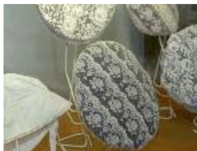
Coiffes catalanes, coll. Casa Pairal.

Puis, au début du XIX e siècle, l'industrie de la dentelle connaît une grande extension à Perpignan ; la coiffe catalane, aujourd'hui partie intégrante du costume traditionnel féminin, est donc assez récente.