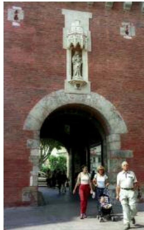
Porte Notre-Dame.