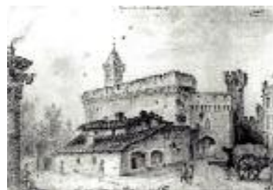
Gravure Bagnères de Luchon, XIX e siècle, coll. privée de Pierre Gorsse, 1956, coll. musée Hyacinthe Rigaud.

Lors de ces travaux, on perce des meurtrières à arquebuses beaucoup plus nombreuses côté ville et on ouvre des fenêtres fortement grillagées sur la façade extérieure. Une terrasse crénelée et un joli lanterneau sont aménagés au sommet du monument pour supporter les canons et surveiller la plaine du Roussillon. Le Castillet s'enrichit également d'une nouvelle porte à l'Est et d'un bastion au Nord (aujourd'hui disparu).