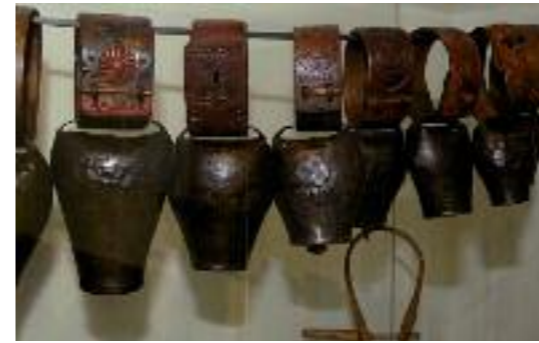
Cloches de moutons, colliers en bois sculptés, coll. Casa Pairal.