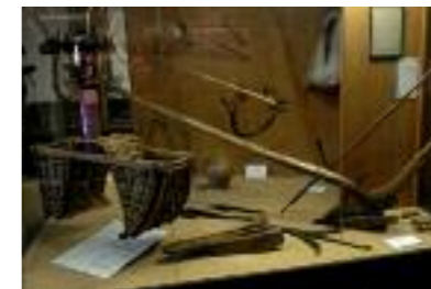
Casa Pairal, vitrine de l'agriculture.

La plaine du Roussillon qui entoure Perpignan était couverte de cultures panifiables et d'oliviers, précieux pour leur huile : qu'elle soit sacrée dans les églises, lumière dans les foyers ou simple alimentation, l'huile d'olive est un des éléments marquants de l'agriculture roussillonnaise.