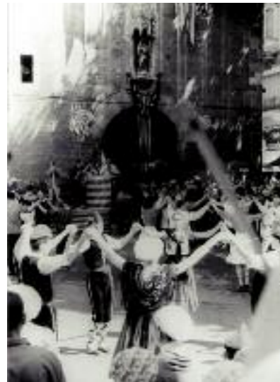
Inauguration du Castillet.

Au début des années 1950, le projet de fondation d'un musée des arts et traditions populaires est repris, encouragé par la municipalité et la découverte par Joseph Deloncle d'un vieux goig (chant religieux populaire sur bois gravé).