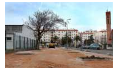
Le jardin du Vilar en plein chantier.

En face de l'église St Paul, l'aire de jeux réservée aux tous petits nécessitait d'être revue et corrigée, ne serait-ce que pour ses clôtures ne répondant plus aux normes. Que les mamans et les nounous se rassurent, la nouvelle aire, agrémentée d'arbres, accueillera les enfants pour les vacances de Pâques ! Combiné à cela, l'espace vert situé à côté méritait d'être ouvert pour dégager l'accès à l'aire de jeux, ainsi qu'une sérieuse rénovation, avec son sol déformé par les racines. Clôtures supprimées, bordures refaites, arbres plantés, bancs installés sur un tout nouveau sol sablé, de quoi en faire un lieu de repos et de rencontres. ■