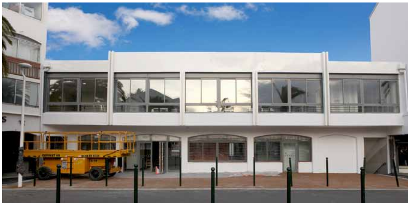
Les nouveaux locaux pour répondre aux attentes des habitants.

Depuis quelques mois, les riverains du Moulin-à-Vent ont eu tout le loisir d'apprécier la nouvelle place de la sardane, notamment le mercredi matin avec le marché. Ils ont également pu constater l'avancement des travaux de ce qui fut anciennement la discothèque La Baratina, où se tient désormais la Mairie de quartier Sud.