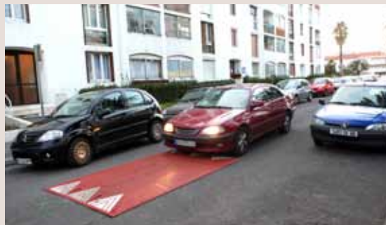
Passage piéton sécurisé rambla du Vallespir.

A fin de promouvoir le développement des modes de déplacements « doux », tels que la marche à pied, le vélo et les transports en commun, la Ville a souhaité agir sur les comportements des usagers afin de garantir sécurité, commodité et confort des déplacements et améliorer le cadre de vie. Pour ce faire, il était nécessaire de restructurer certaines voies et influencer sur la conduite des automobilistes de façon à ce qu'ils modèrent leur vitesse. Ce résultat n'a pu être obtenu que par la réalisation de ralentisseurs et d'îlots de sécurité. Concernant le secteur Sud, qui a vu se développer les pistes cyclables, la rue de