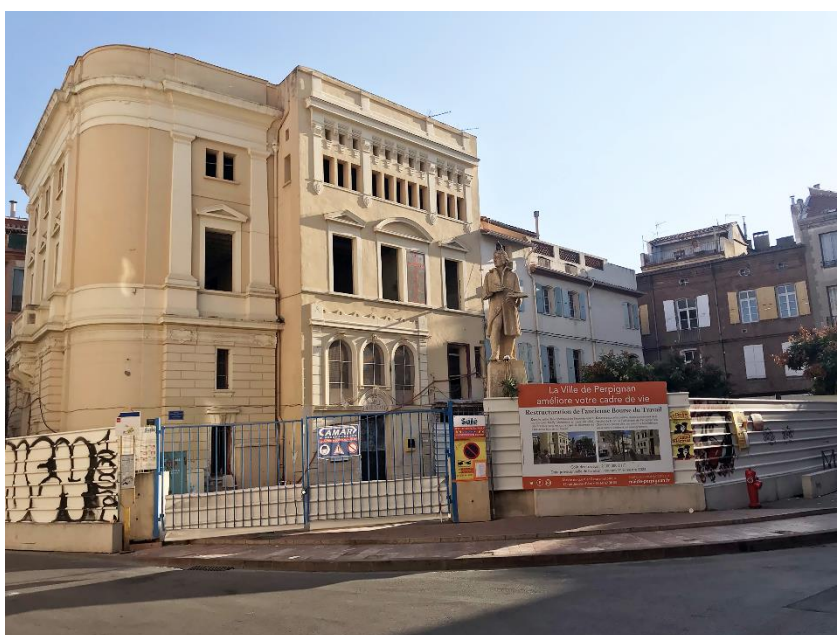
Travaux de la future bibliothèque universitaire.