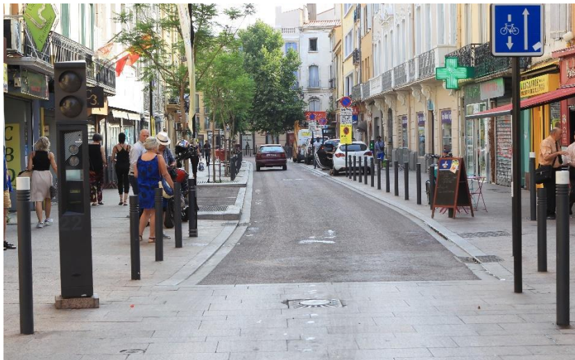
La rue Foch.

Sa vocation est donc bien de requalifier cet axe structurant du cœur de Perpignan.