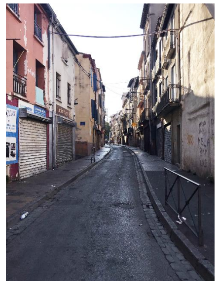
La rue Llucia.