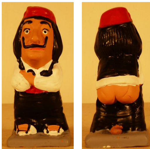
Santon du caganer à l'effigie de Salvador Dali

Sous sa vocation de caricature, le caganer se décline avec humour à l'infini : chaque année les stars, les politiciens et autres personnages publics ont droit à leur figurine de caganer .