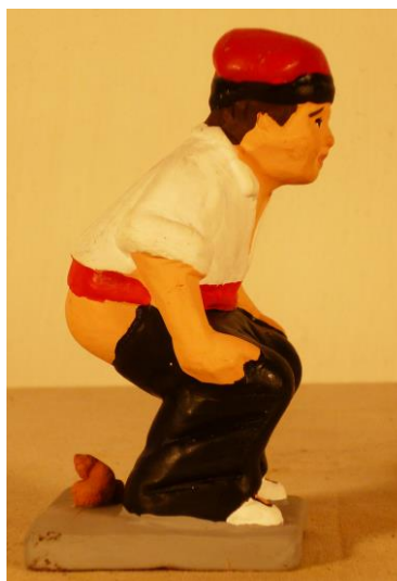
Santon du caganer qui, traditionnellement, figure un paysan catalan souvent coiffé de la barretina (béret catalan).

Le caganer (ou, traduit littéralement : « chieur »), est un personnage récurrent des décors du Noël catalan ou pessebres . C'est un santon que l'on trouve en Catalogne, au Pays Valencien et aux îles Baléares et qui a plusieurs significations. Il existe aussi de petits sujets similaires à Murcie, à Naples et au Portugal, nommés respectivement cacones , pastore che caca et cagoes .