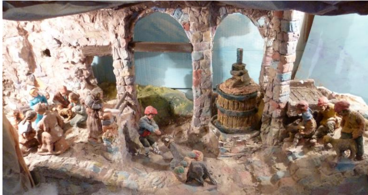
Pessebre au cellier des collections de la Casa Pairal

Les pessebres sont des décors de Noël traditionnels en Catalogne, composés de plusieurs personnages et dans lesquels se situe une représentation de la nativité dans la religion chrétienne, la crèche. Au XVII e siècle, les pessebres étaient commandés par l'aristocratie et recevaient la visite d'un public très nombreux. Par la suite, cette coutume s'est étendue à l'ensemble de la population. Il reste aujourd'hui un rendez-vous attendu des fêtes de fin d'année et un lieu d'expression de l'art populaire.