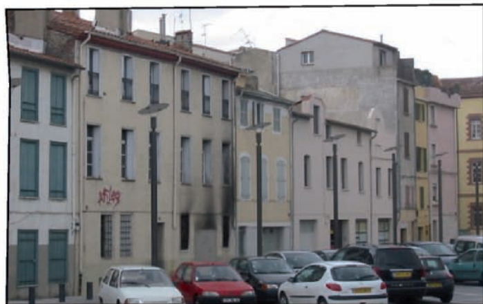
Rue Abadie, vue d'ensemble avant travaux.