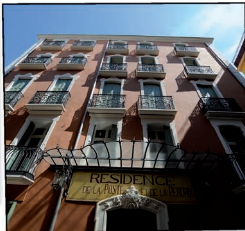
Rue Grande des Fabriques (5 logements).