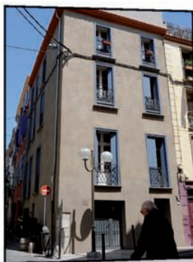
2 bis rue Saint-Mathieu, avant et après travaux (3 logements).