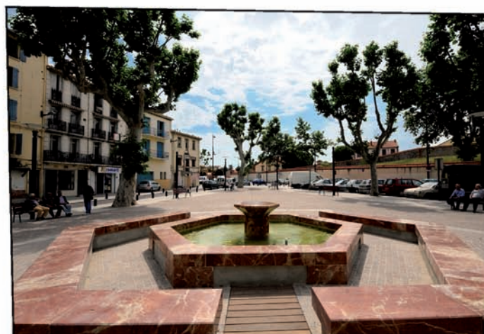
Place des Esplanades.