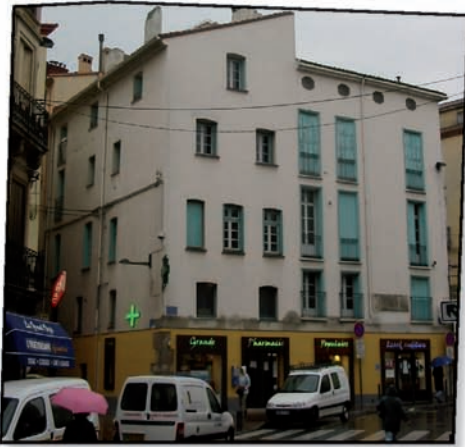
1 rue des Augustins avant et après travaux (5 logements).

Les quartiers saint-matthieu, saint-jacques, La Réal et saint-jean Placés au Coeur Des Priorités De la Ville De Perpignan.