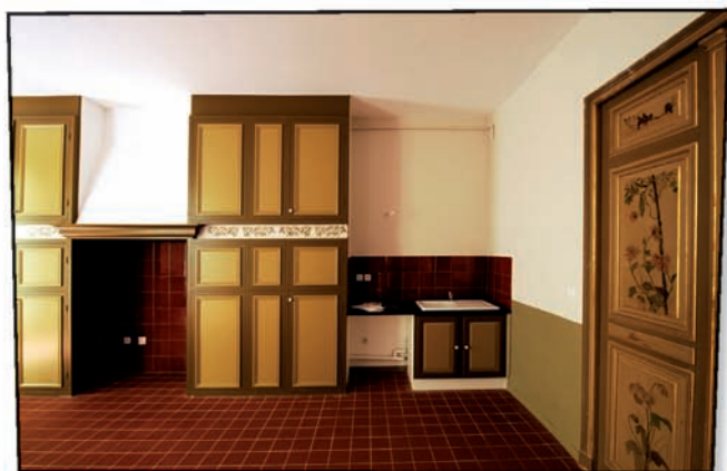
39 rue Grande La Réal.