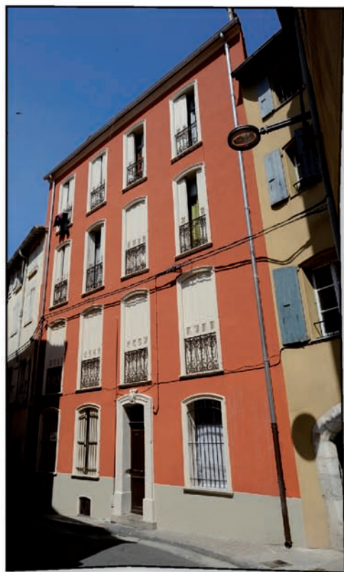
4 rue de la Vieille intendance (6 logements).