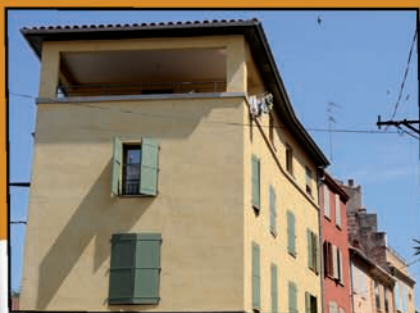
Rue des Carmes avant, pendant et après travaux (5 logements).