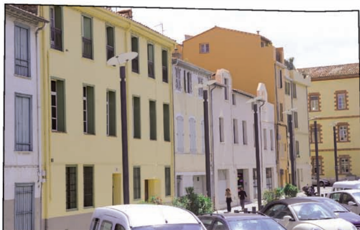
Rue Abadie, vue d'ensemble après travaux.