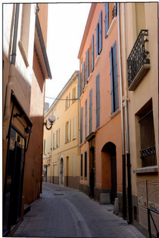
Rue Lazare Escarguel, vue d'ensemble après travaux.