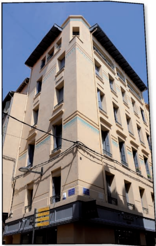
Angle des rues des Trois-Journées et de l'Argenterie (5 logements).