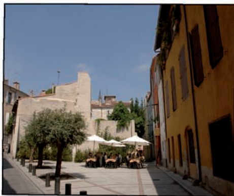
Place Jaubert de Passa.