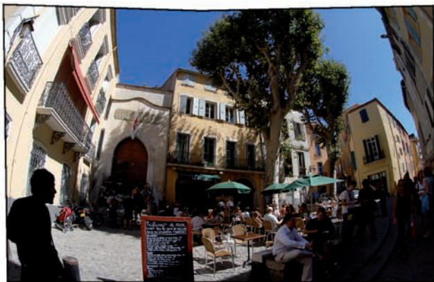
Place de la Révolution française.