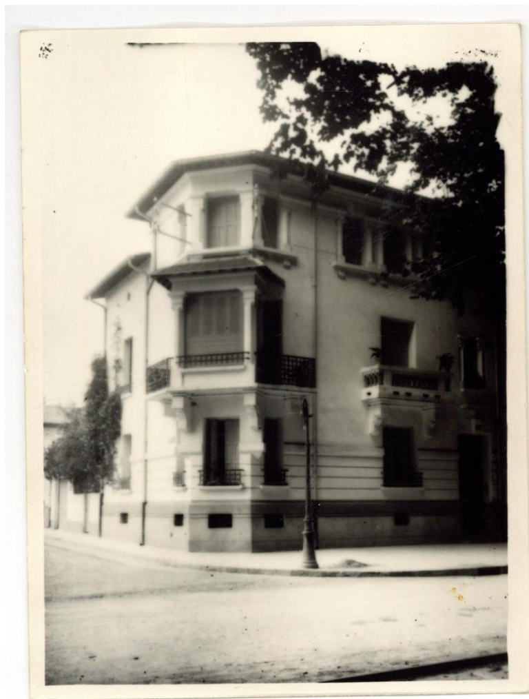
Photographie issue du tirage d'une plaque de verre de Claudius Trenet

(Archives municipales Camille Fourquet, 5S1/21)