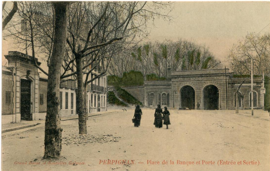
Avant 1905, à gauche la banque de France, au fond la porte de la République