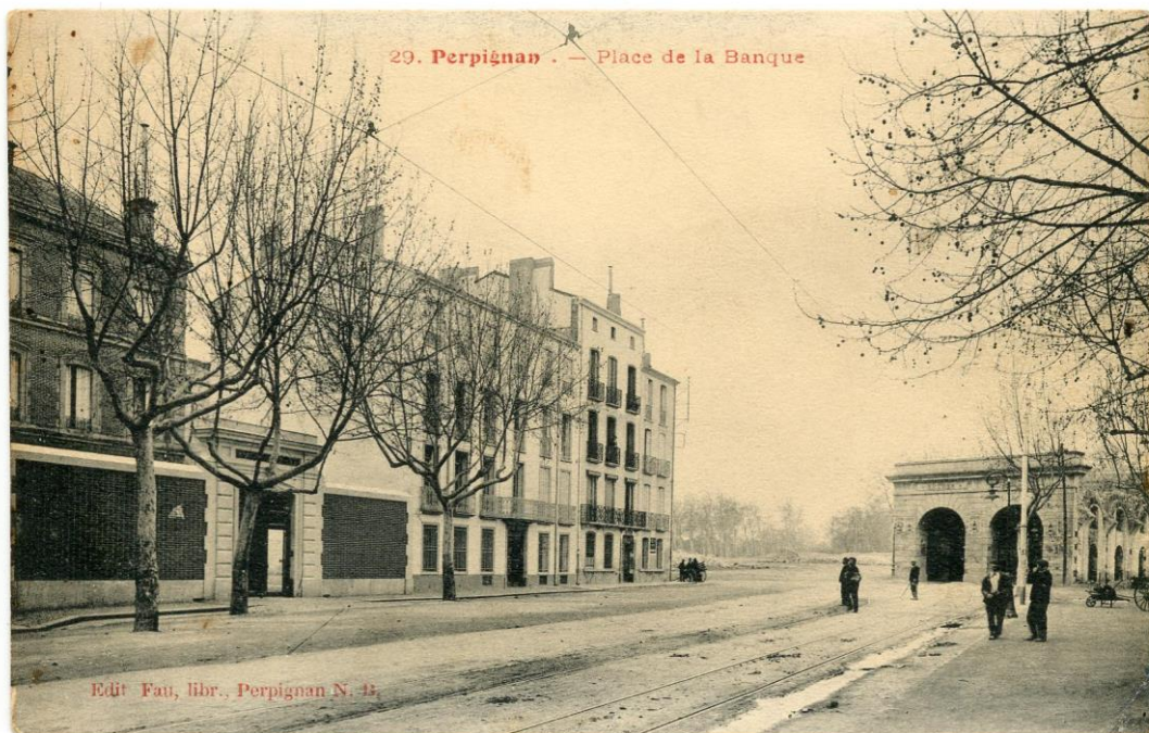
La Banque de France pendant la démolition des remparts (fin 1904, début 1905)