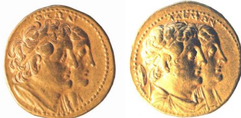
Bustes de Ptolémée II et Arsinoë II / Bustes de Ptolémée I et Bérénice 4 e siècle (365 à 323) av. J.-C.

Son successeur, Ptolémée II, remplacera celui-ci par son buste accolé à celui de son épouse sur une face et celui de son père et de sa mère sur l'autre côté.