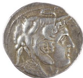
Buste de Ptolémée I/ Athéna avec l'aigle d'Alexandrie 4 e siècle (312) av. J.-C.

C'est le cas de Ptolémée qui récupère l'Egypte et coiffe la tête d'Alexandre de la peau d'un éléphant, animal symbole de l'Afrique.