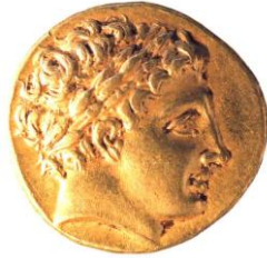
Buste d'Apollon / Bige 4 e siècle av. J.-C. Pella (Macédoine)