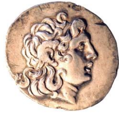
Buste d'Alexandre le Grand/ Athéna assise 4 e siècle (365 à 323) av. J.-C. Thrace

Ce n'est qu'à partir d'Alexandre le Grand que vont apparaître les portraits plus ou moins réalistes, sur les monnaies.