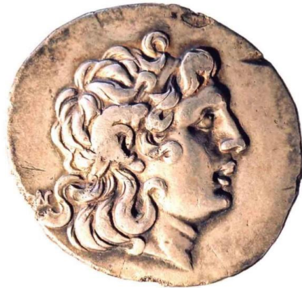
Buste d'Alexandre le Grand - IV e siècle av. J.-C., Thrace - sur un tétradrachme en argent.