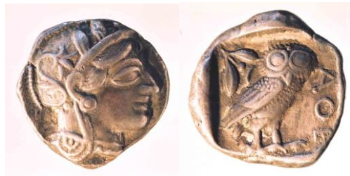
Buste d'Athéna / Chouette 5 e siècle av. J.-C. Athènes

Arrivée en Grèce puis diffusée dans les colonies (Sicile, Egypte...), la monnaie est largement frappée et utilisée. Mais, dans un premier temps, aucune ne présente de portraits de personnes vivantes. Ce sont des représentations des dieux et déesses ou de symboles (animaux, objets...) représentatifs d'une cité :