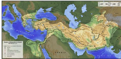
carte de l'Empire d'Alexandre à son apogée

Alexandre le Grand (né en 356 av. J.-C. à Pella et mort en 323 av. J.-C. à Babylone), roi de Macédoine, est l'un des plus grands conquérants de l'histoire, car il a pris possession de l'immense Empire perse en s'avançant jusqu'aux rives de l'Indus.