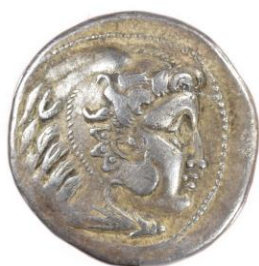
Buste d'Alexandre en Hercule avec peau du lion/ Epona ? avec cheval 4 e siècle (336-323) av. J.-C.

Le buste d'Alexandre le Grand sera également repris par les Grecs et les Gaulois pour frapper des tétradrachmes en argent, pièces fortes en circulation dans le monde méditerranéen jusqu'en 250 av. J.-C., date du début des conquêtes romaines