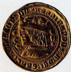
Dix ducats d'Or.