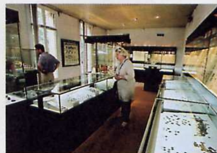
Salle d'exposition permanente.

De 1958 à 1984, le legs permet la création d'un cabinet numismatique ouvert aux chercheurs et amateurs. Depuis 1984, deux salles d'exposition présentent une partie de cette extraordinaire collection de 45 000 monnaies et médailles. La première est consacrée aux monnaies catalanes et à celles frappées à Perpignan, tandis que la seconde est réservée aux expositions temporaires.