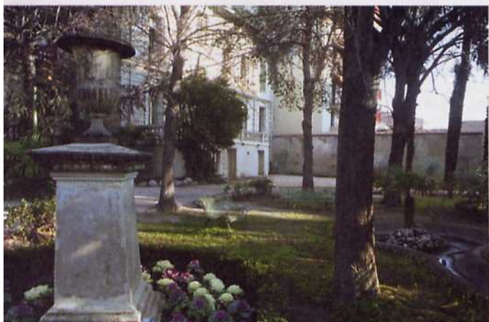
Le parc.