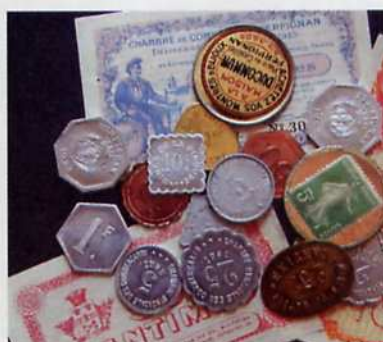
Monnaies de nécessité.

Des billets, mais surtout des pièces en métaux ordinaires ou en carton et aux formes diverses (rondes, dentelées, carrées, rectangulaires, octogonales...) sont ainsi fabriqués en fonction de la fantaisie du commerçant.