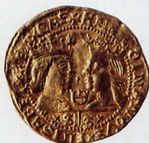
Double ducat d'or.

Christophe Colomb n'a pas seulement découvert l'Amérique, mais aussi quantité d'or qu'il envoie à ses mandataires, les Rois Catholiques. Avec cet or « américain », les rois frappent de nouvelles monnaies, comme le « dix ducats d'or » de Ferdinand II (XV e siècle) dont il n'existe que trois ou quatre exemplaires dans le monde ou le « double ducat d'or » représentant le roi Ferdinand et la reine Isabelle affrontés. Bien que très rares, le musée J. Puig détient plusieurs exemplaires de ce type de monnaie.